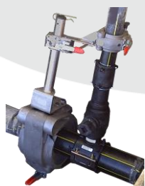
Maintien de la dérivation