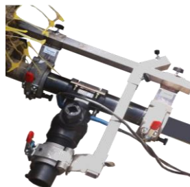
Maintien de la selle