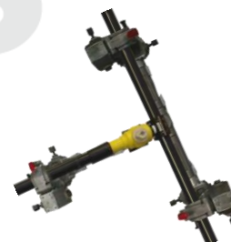
Maintien de la dérivation