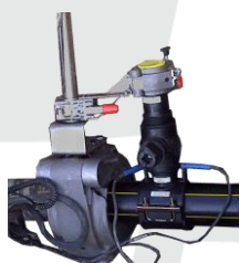
Maintien de la selle